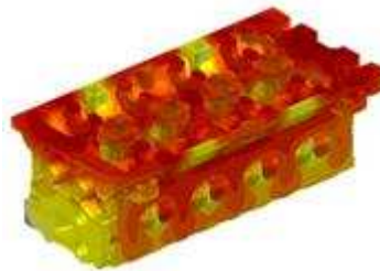
Monoblock de aluminio para motor

ProCAST y QuikCAST Proveen una solución computacional completa que permite predicciones para evaluar todo el proceso de fundición incluyendo: